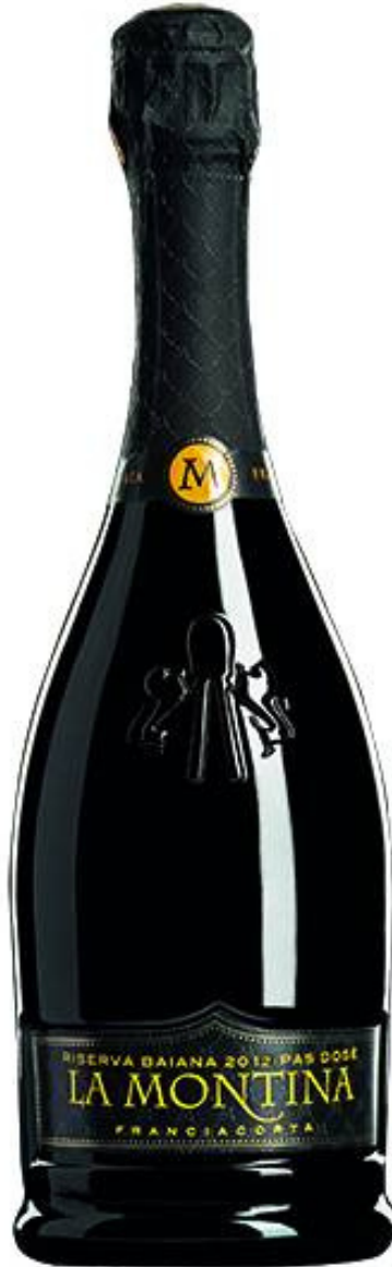
45% Pinot Nero