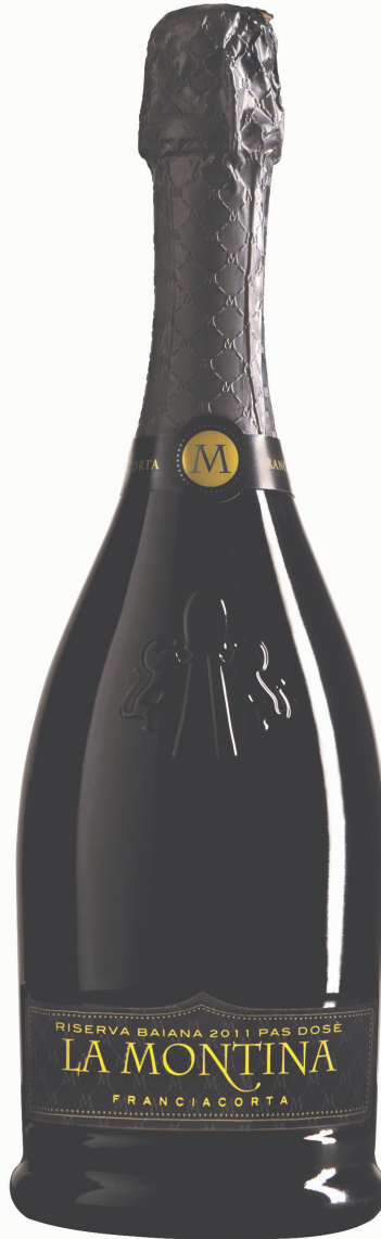
45% Pinot Nero