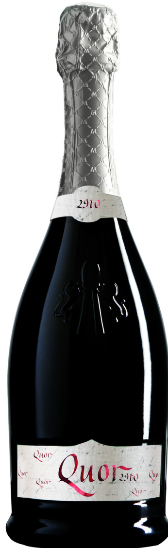
35% Pinot Nero